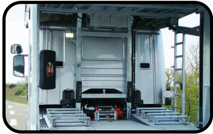
* Galvanisation intégrale de l'équipement.