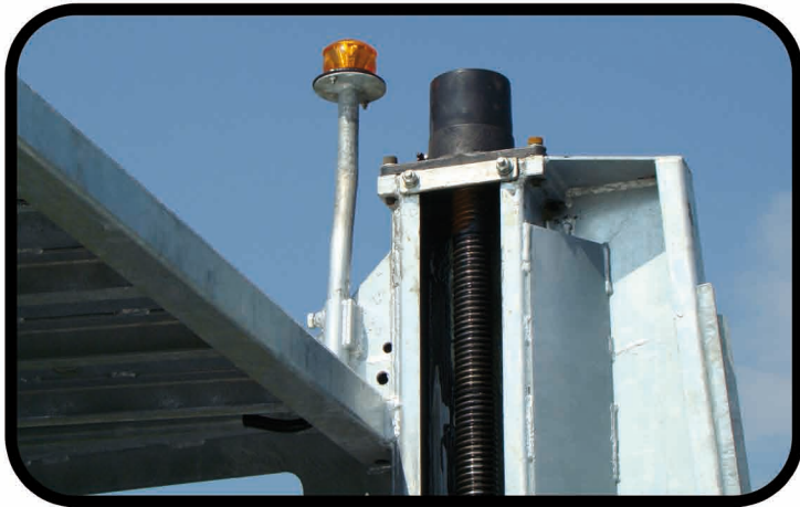
* Gyrophares à leds sur supports au-dessus des poteaux à vis.