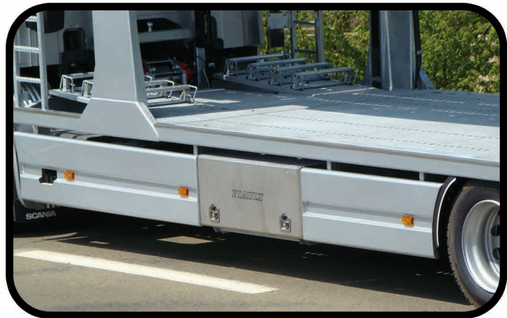
* Carénages stylisés en aluminium avec coffres inox intégrés.