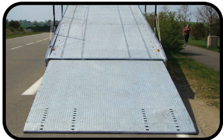
* Plancher tôles à larmes spécial pour le transport de véhicules roulants ou accidentés.