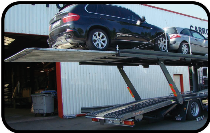
- Rampes de chargement intégrales entièrement galvanisées.