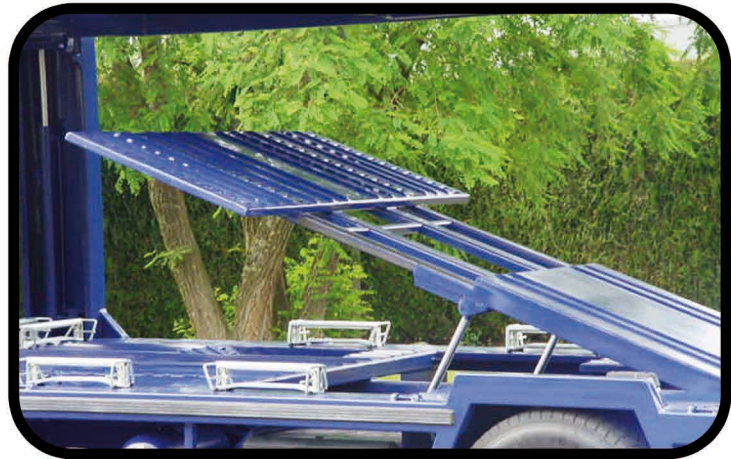
* Gerbeur hydraulique augmentant la capacité de chargement sur plancher inférieur (sur 26T).